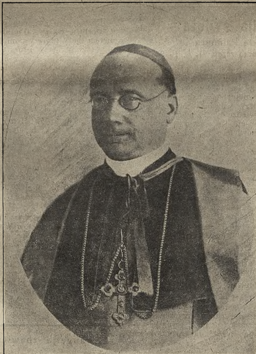
Nowy Nuncjusz Stolicy Apostolskiej w Polsce J. E. ks. Arcybiskup FRANCISZEK MARMAGGI.

Niestety przyszedł przewrót majowy, którego pierwszym skutkiem był zupełny upadek wpły-