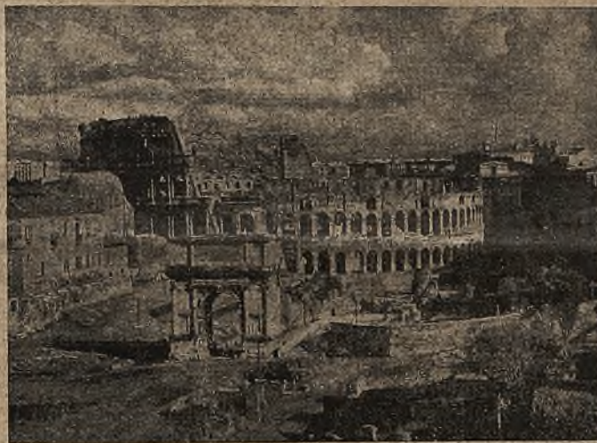
Ruiny „Kolosseum” wielkiego cyrku, w którym odbywały się krwawe igrzyska (a także męczeństwo pierwszych chrześcijan) dla zabawy ludu rzymskiego. Zbudowany za czasów cesarza pogańskiego mieścił ten cyrk 80 tysięcy widzów.