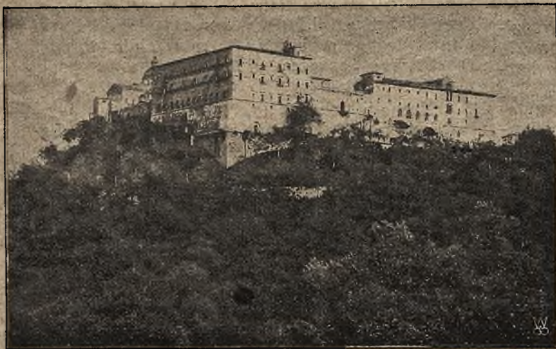
Piękny zamek starożytny.

1) nabywania drogą kupna lub najmu wszelkich nieruchomości; tylko poszczególnym członkom wolno nabywać lub odnajmować domy, place i inny inwentarz nieruchomości na cele kultu. 2) Nie wolno udzielać nauki religji, ani w szkołach państwowych, ani publicznych, ani też w zakładach wychowawczych. Nauka ta dozwoloną jest jedynie w seminarjach duchownych, akadem-