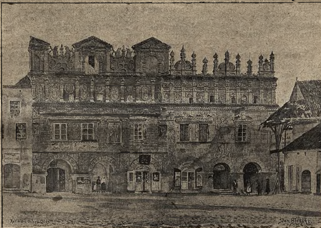
Kazimierz Dolny (wojew. lubelskie), piękne domy zbudowane przed 300 laty.