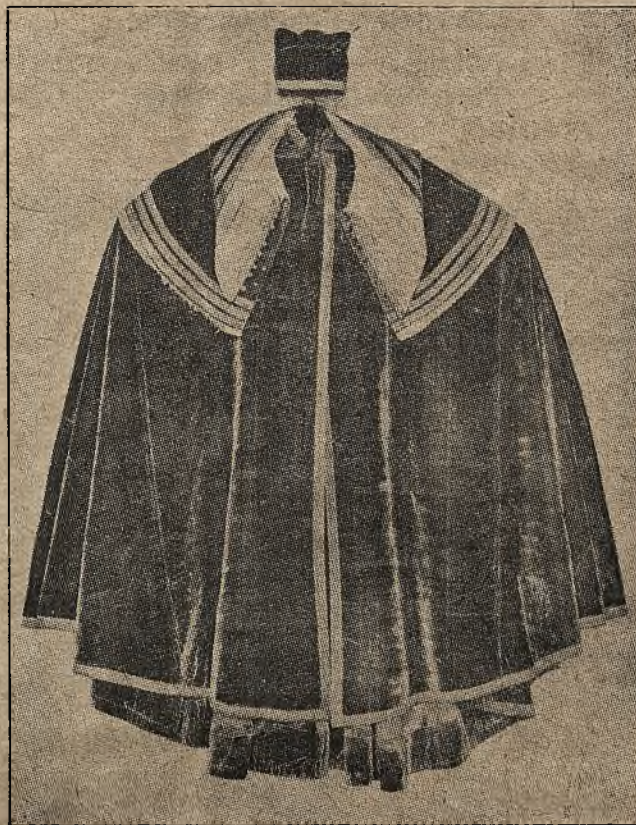
- Toga i biret rektorski Skargi.

Nabożeństwo to odbyło się w kościele św. Jana, a celebrował je Arcybiskup Ropp. Jednocześnie zostały odprawione przy trumnie z prochami Lelewela egzekwie.