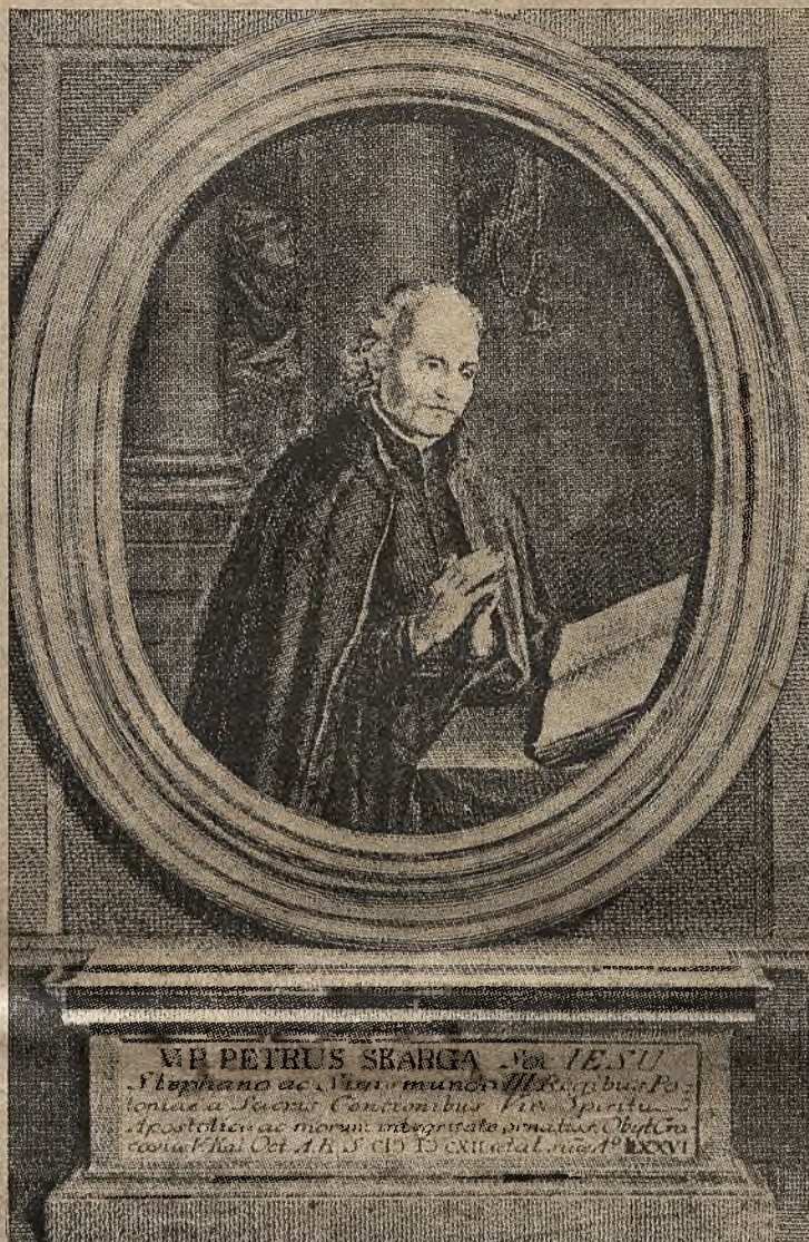
Ksiądz Piotr Skarga, pierwszy rektor U. S. B.

Rozpoczęły się uroczystości od Nabożeństwa żałobnego za dusze wszystkich zmarłych proferorów, studentów i pracowników Uniwersytetu Stefana Batorego