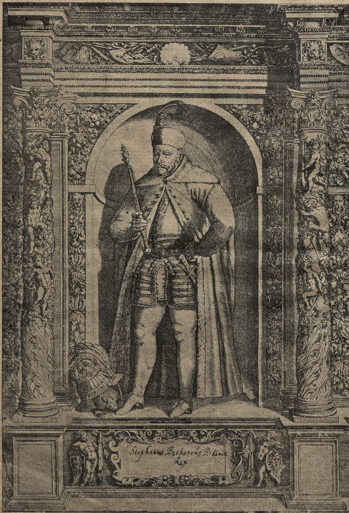
KRÓL STEFAN BATORY. Założyciel Uniwersytetu Wileńskiego.