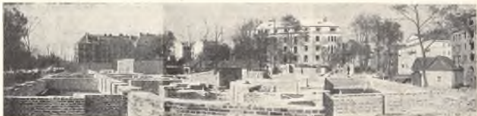
Budowa jednej z nowych dzielnic Warszawy. Lavori di costruzione in uno dei nuovi quartieri di Varsavia.