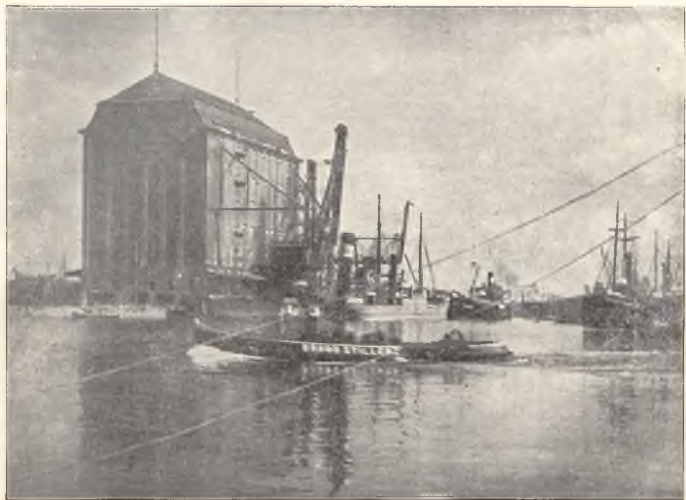
Gdańsk. Fragment portu. Danzica. Frammento del porto