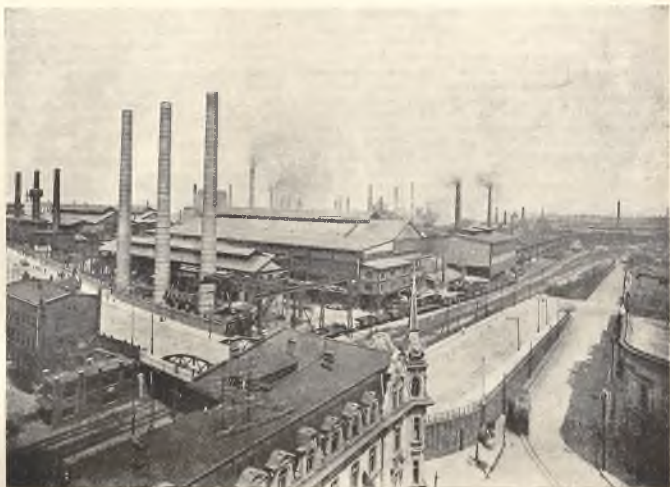
Huty „Królewska” i „Laura” na Górnym Śląsku. Le fonderie „Królewska” e „Laura” nell’Alta Slesia.