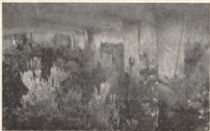
Stary las świerkowy w okolicach Wilna. Una vecchia foresta di pini nei dintorni di Vilno.