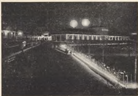
Jeden z pawilonów Powszechnej Wystawy Krajowej w Poznaniu. Uno dei padiglioni della Esposizione Generale Polacca a Poznań.