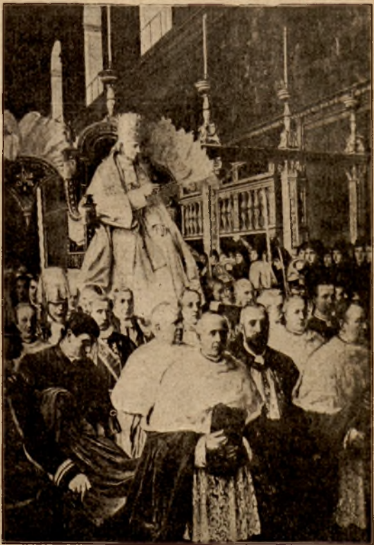
Ojciec św. Leon XIII, Papież, błogosławiący pielgrzymów.