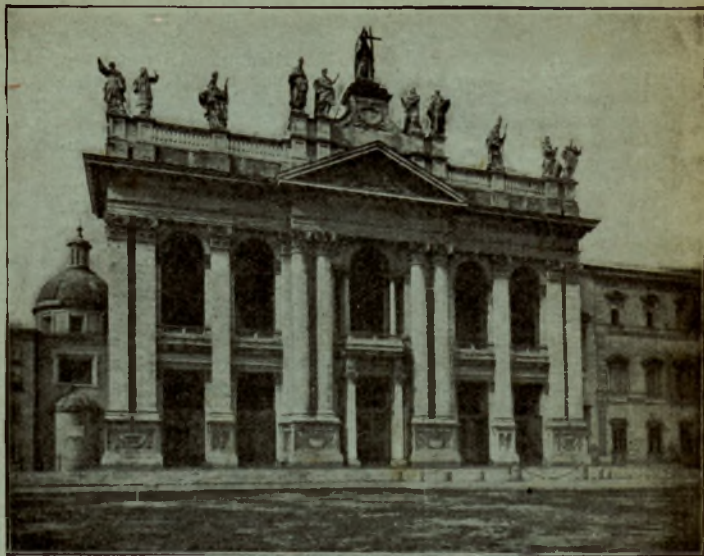
Bazylika czyli kościół św. Jana Laterańskiego w Rzymie.

Podróż pielgrzymki z Krakowa do Rzymu i z powrotem do Krakowa — wraz z dziesięciodniowym utrzymaniem w Rzymie — kosztuje: III kl. 70 złr., (120 marek, 58 rubli); II klasą 120 złr. (190 marek, 95 rubli); I klasą 150 złr. (268 marek, 120 rubli). Pielgrzymi dojeżdżający ze wszystkich stacyj kolejowych w Galicyi i na Bukowinie, otrzymają bilety za pół ceny do Krakowa. Bilet pielgrzymkowy służy na 60 dni, można więc z powrotem zatrzymać się tak długo jak kto zechce, byleby nie przedłużyć oznaczonego czasu.