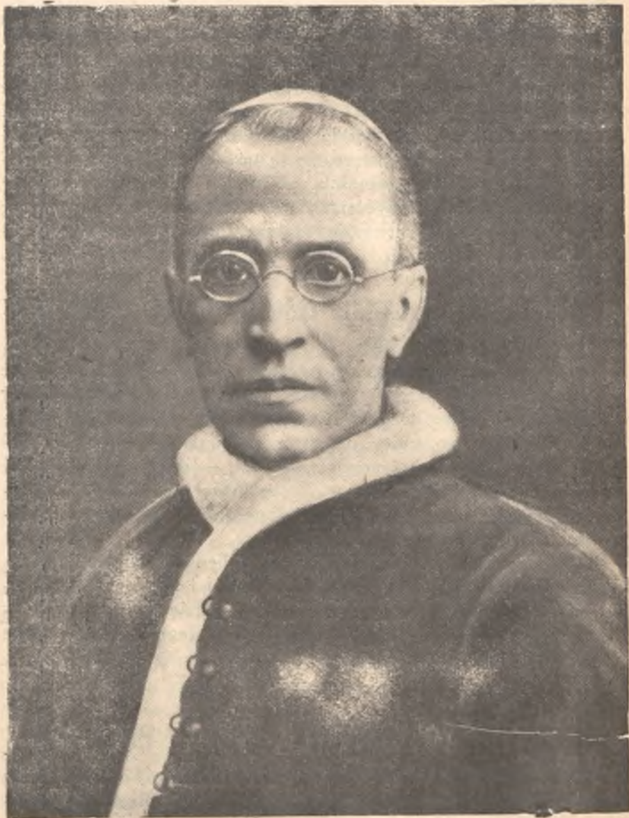
OBECNY OJCIEC ŚW. PIUS XII

MIESIĘCZNIK AKCJI KATOLICKIEJ DIEC. SANDOMIERSKIEJ