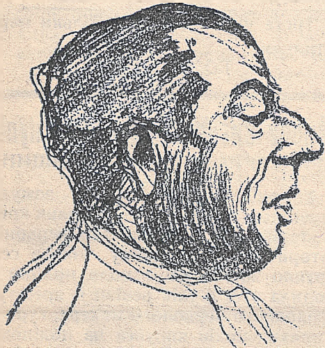
„Французький. Ленін“, оборонець Шварцбарта, жид Мойше Торез.

Пригадаймо собі: 25. травня 1926 р. в Парижі цей злочинець підійшов до бл. п. Отамана Петлюри. „Ви Петлюра?“ — спитав. „Так“ — відповів Отаман, що ніколи не скривався й завжди виступав явно. У відповідь Шварцбарт стріляє. Окривавлений Отаман осувається на землю,