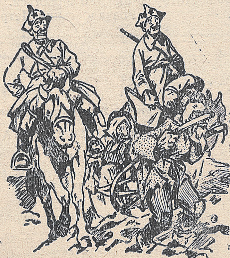
Такий „рай” хочуть вони завести у світі!

Політбюро приділило Комінтернові великі додаткові фонди з тайних фондів ради наркомів. Водночас поширено пов-