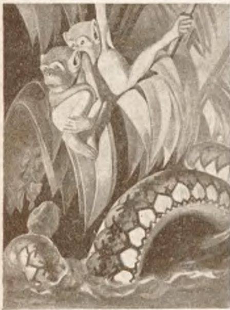
III. Nagroda poza konkursem. S. Żechowski, Kraków. Rys. do F. A. Ossendowskiego: Życie i przygody małpki . Bibl. Iskierek. T. III.

Wydanie niniejsze historycznego dramatu największego poety niemieckiego zawiera, obok tekstu, oparteo na najlepszych wydaniach niemieckich, także mały słowniczek, ułożony według scen i zaopatrzone w metodyczne pytania, mające służyć do pogłębiania lektury, ogólne uwagi o dramacie i najcenniejsze daty z życia poety.