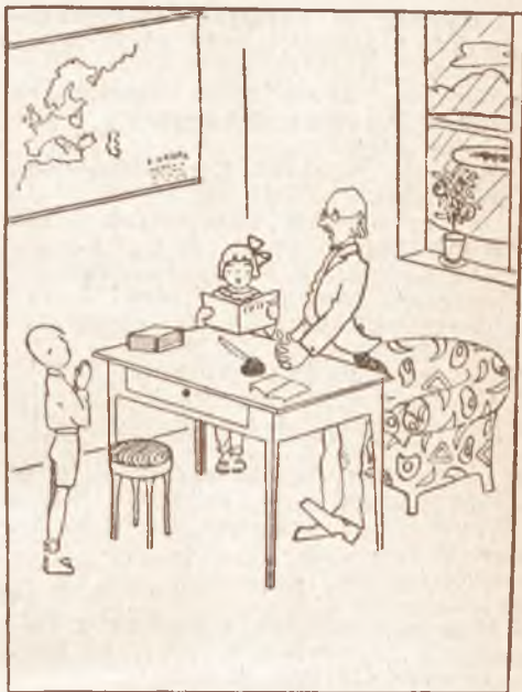
III. Nagroda. B. Stuszkiewiczówna, Lwów. Rys. do Z. Rogoszówny: Dziecinny dwór. Biblj. Iskierek. T. I.