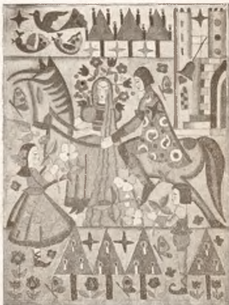
I. Nagroda poza konkursem. I. Hölzel, Lwów. Rys. do Z. Górskiej: O księciu Gólfrydzie. Bibl. Iskierok. T. VI.

Im większa podziałka, a tem samem dokładność mapy, tem ściślejsze jej zbliżenie do rzeczywistości, a symbolika znaków bardziej rozumiała. Ideałem przeto w nauce geografji byłoby stosowanie systematyczne planów