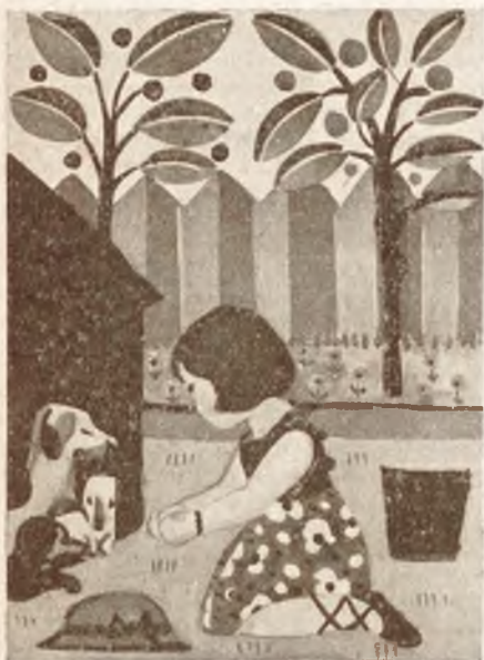
I. Nagroda poza konkursem. A. Manelska, Lwów. Rys. do T. Rogoszówny: Dziesięć dwór . Bibl. Iskierk. T. I.

rzę, wniknięcie w ich psychologię, zwłaszcza w stosunku do ludzi, jest znakomite . Nie brak też wyraźnej tendencji etyczno-wychowawczej“.