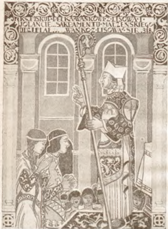
I. Nagroda. T. Kłrschner, Lwów. Rys. do F. A. Ossendowskiego: Wańko z Lisowa. Biblj. Iskier. T. XXIII.

Wystarczy porównać mapę woj. łódzkiego, która ukazała się pierwsza, z mapami wydanych obecnie — również nizinnych — województw wschodnich, by przekonać się o olbrzymim postępie technicznym, którego dokonano w ciągu kilku lat. Precyzja wykonana, przejrzystość — mimo znacznego wzbogacenia treści — dyskretny opis i estetyka barw tworzą z każdej mapy z osobna i w zestawieniu obok siebie naprawdę harmonijną całość. W opracowaniu naukowym treści doprowadzono je zawsze do uzgodnienia ze stanem faktycznym z daty wydania.