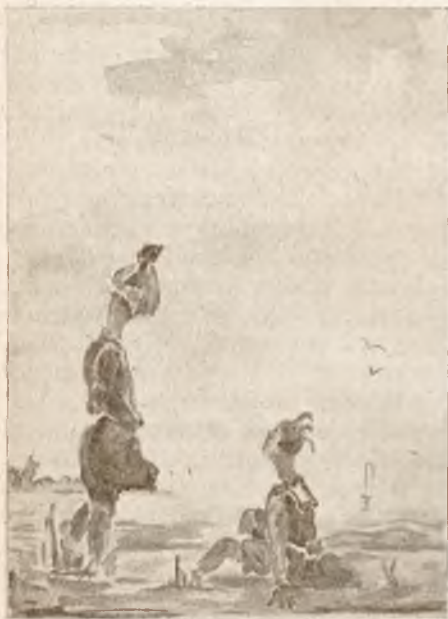
H. Nagroda. W. Fusek, Gorlice. Rys. do K. Dickensa: Dawid Copperfield. Biblj. Iskier. T. XI.

Często zachodzi potrzeba wyodrębnienia poszczególnego zagadnienia, czy grupy zagadnień, z mapy fizycznej, czy innej, w celu unaocznienia ich lub