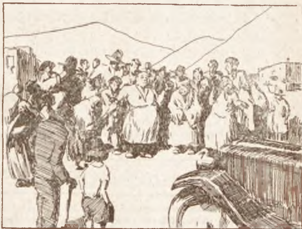
III. Nagroda. J. Kurowski, Warszawa. Rys. do Biblj. Iskier. T. IX.