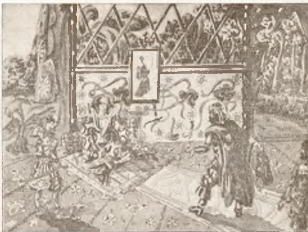
II. Nagroda. St. Kołusznik, Warszawa. Rys. do M. Smolarskiego: Przygody polskich podróżników . Biblj. Iskier. T. XXXI.

Zdaniem O. Forst Battaglii, wyrażonem w Litterarischer Handweiser , r. 1929, nr. 10, powieść ta zainteresuje tak młodzież, jak i dorosłych, jest bowiem: „Eine reizende, ...zahme, aber dabei witzige Kultursatire“ . Młodzieży poleca ją również J. G. w Pracy Szkolnej , r. 1929, nr. 1, który pisze: „Książeczka ta stanowić będzie naprawdę miłą rozrywkę dziecka i zapewne nauczy je kochać zwierzęta. Poza tem młody czytelnik zaznajomi się z fauną i florą afrykańską, którą autor opisuje bardzo interesująco, a wśród której chowała się młoda szympansiczka Kaśka, dopóki nie dostała się do ludzkiej niewoli, gdzie życie jej było całkiem odmienne niż w dżungli afrykańskiej. W książce tej spotykamy się tu i ówdzie z sytuacjami wzruszającymi, a nawet rozrzuwającymi“. Pochlebnie ocenia ją również recenzent Pod Znakiem Marji , r. 1929, nr. 6, który pisze: „Sławny podróżnik okazuje się w tej książce doskonałym pisarzem dla dżiatwy . Może samo ujęcie powieści jako pamiętnika, pisanego przez małpkę, jest nieco za śmiałe, podobnie jak niektóre poglądy, wyrażone tu i ówdzie w ciągu opowiadania, poza tem jednak opisy przyrody, podpatrzenie życia zwie-