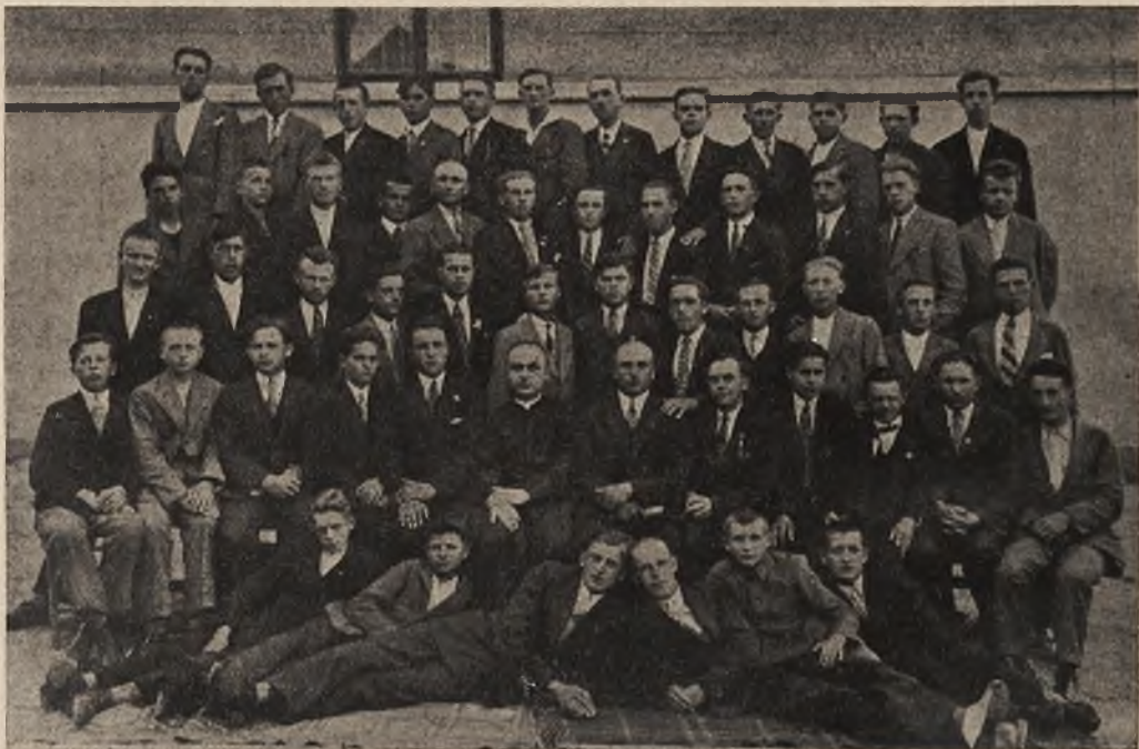
Uczestnicy Rekolekcji zamkniętych w Tarnowie

Czyż te proste słowa druha nie głoszą wielkiej wartości tych św. ćwiczeń?