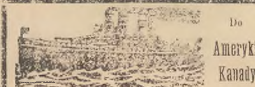
Do Ameryki Kanady