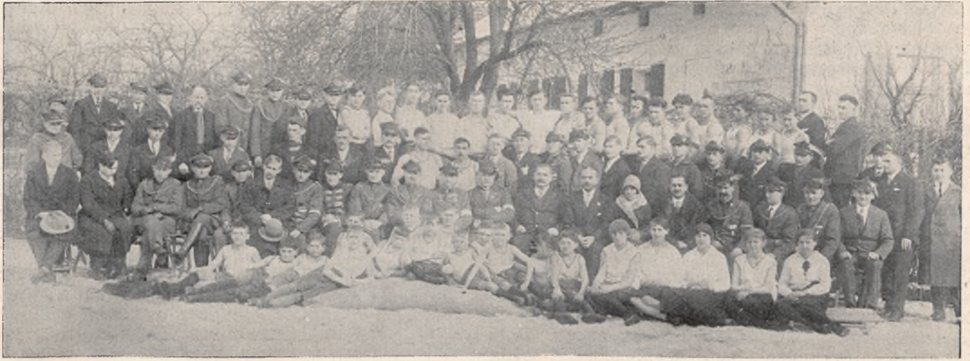
Rewja i lustracja techniczna Okręgu IX. dnia 16-go lutego 1930 roku

S. wierdzając dodatnie wyniki naszej pracy zesłorocznej Prezes okręgu podziękował wszystkim gorliwym Sokolom za ich pracę i poświęcenie, zachęcając do dalszego wytrwałego pozostania na tym posterunku, poczem podał do wiadomości spis ustępujących członków zarządu.