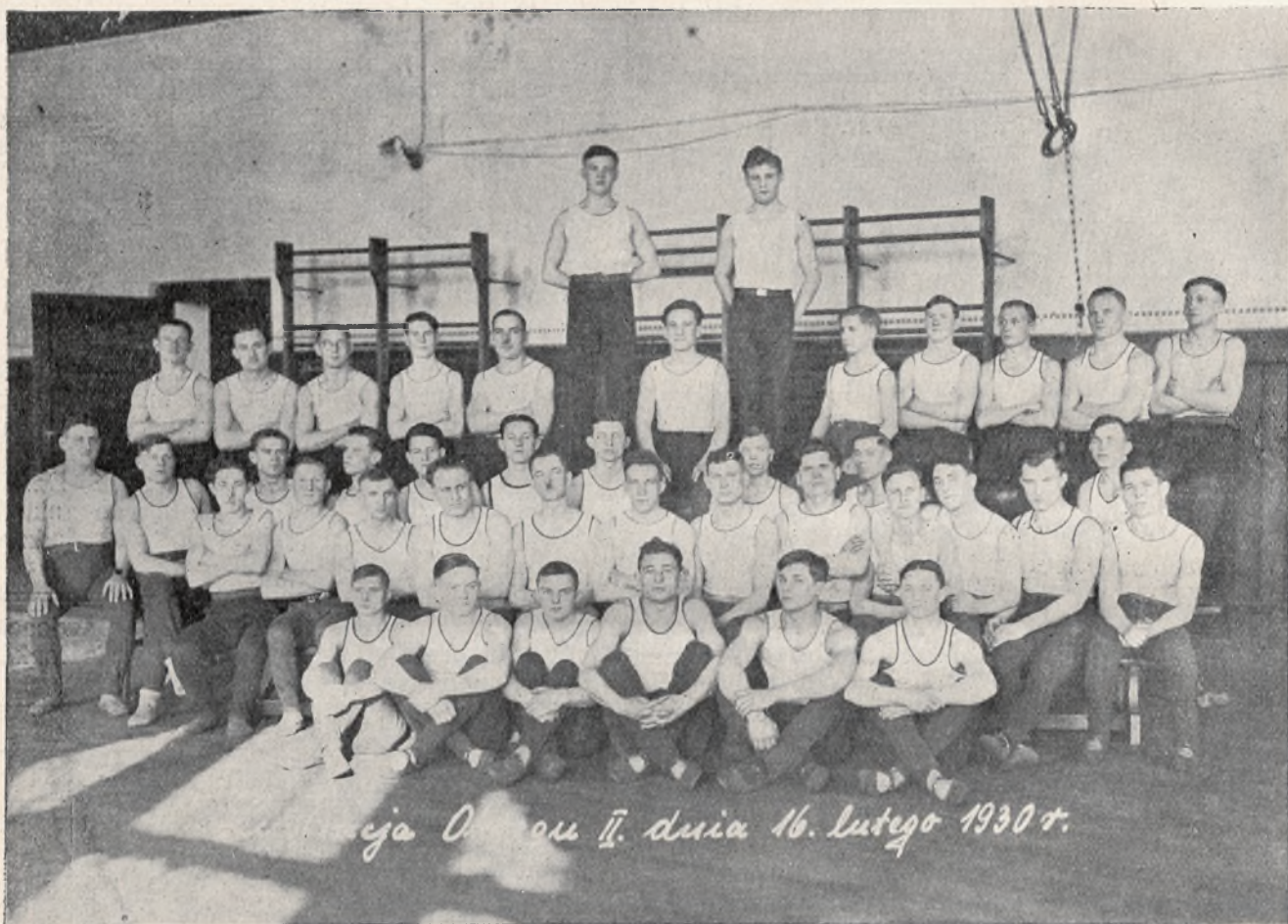
Fotografia druł i druchen Okręgu II. dnia 16. lutego 1930 r.