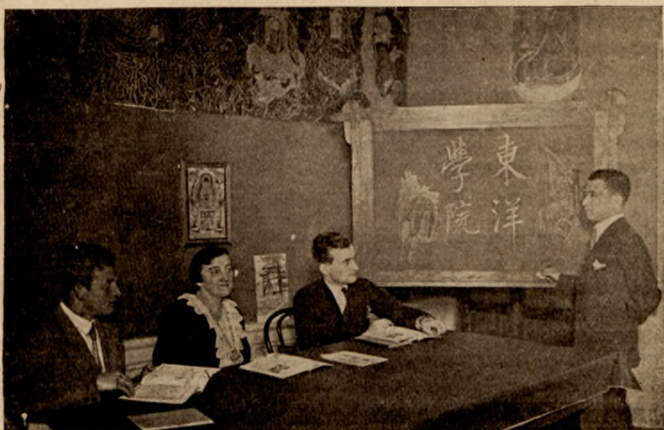
Wykład w Instytucie Wschodnim.

Wyszły już trzy wydawnictwa własne: „Afganistan“ (1928 r.; str. 50); „Gruzja w zarysie historycznym“ (1929 r.; str. 230); „Krym“ (1930 r.; str. 194). Wykonano mapy (dużych rozmiarów) Chin, Turcji, Kaukazu; w opracowaniu jest mapa Persji. Instytut gromadzi bibliotekę dzieł o Wschodzie, która liczy obecnie ok. 2200 tomów. Ponadto rozpoczęto katalogowanie orjen-