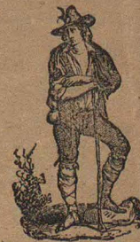
CAMPAGNE DE ROM