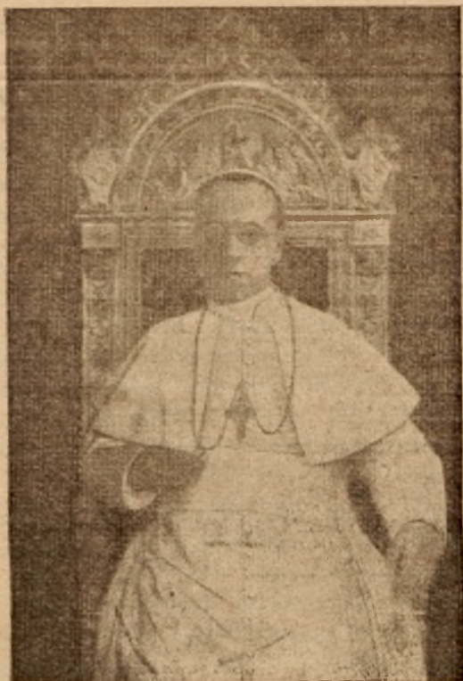
OJCIEC ŚW. PIUS XII.