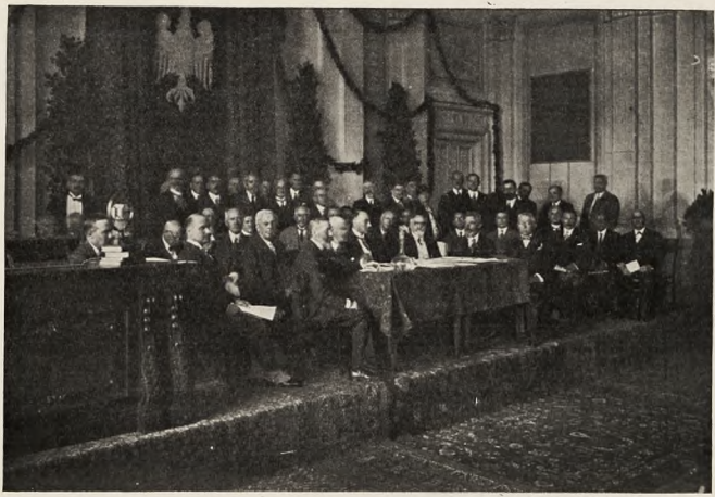
Prezydium VIII Międzynarodowej Konferencji Chemicznej.

jące oznaczonym przy pomocy nazwy jego gatunkom. Podobne wnioski zostały przyjęte przez komisję paliw stальных z tą tylko różnicą, że zdecydowano tu również znormalizować aparaty używane do analizy paliw stalnych. W komisji higieny przemysłowej zastanawiano się nad nieszkodliwieniem dla zdrowia gazów siarkowodorowych, wydzielających się podczas takiej produkcji, jak fabrykacja czerni siarkowej, jedwabiu sztucznego i t. p. Zaproponowano wyznaczenie nagrody pieniężnej za najlepszą pracę, posiadającą znaczenie praktyczne dla rozwiązania powyższego zagadnienia. Zdecydowano również wnieść na porządek obrad następnego Kongresu sprawę ochrony robotników przeciwko gazom i parom, wydzielającym się przy fabrykacji półproduktów i barwników oraz podczas procesów farbowania lub drukowania tkanin. Komisja produktów ceramicznych przeprowadziła dyskusję nad analizą chemiczną materiałów ceramicznych, oraz wniosła na porządek obrad sprawę ujednolicenia terminologii w tej dziedzinie wytwórczości. Komisja własności naukowej i przemysłowej postanowiła przedstawić Lidze Narodów raport i wnioski, dotyczące patentu międzynarodowego. Inne wnioski, przyjęte w dość znacznej liczbie przez działające komisje oraz przedstawione na plenarnym posiedzeniu posiadają raczej charakter naukowy i dotyczą niektórych zmian nomenklatury chemicznej, spraw wzorców termodynamicznych i t. d. Obrszere sprawozdanie z prac Konferencji War-