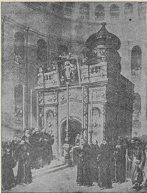
Grób Chrystusa w Jerozolimie (w Bazylice).