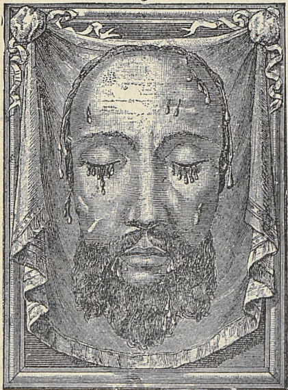
Prawdziwy wizerunek Najśw. Oblicza P. Jezusa Chrystusa w Rzymie w Bazylice św. Piotra na Watykanie ze cziq przechowywany.