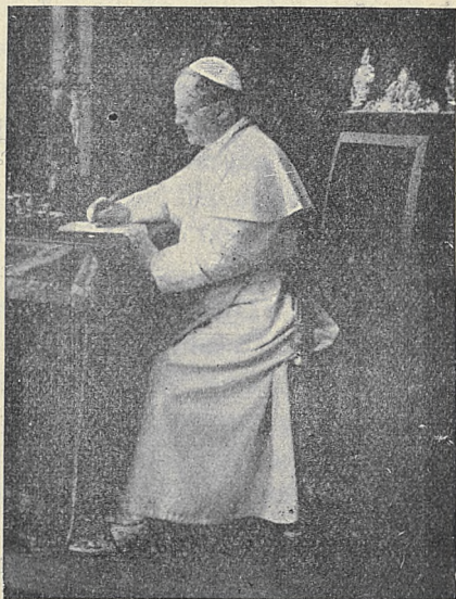
Ojciec św. Pius XI.

czając raz uwielbienie: „Spraw to Matko święta” i td. albo inne podobne; w końcu zbliżyć się należy do Konfesji i odmówić jeszcze raz wyznanie wiary Katolickiej zwykłą formułą wymienioną powyżej. Od dopełnienia tych wszystkich warunków