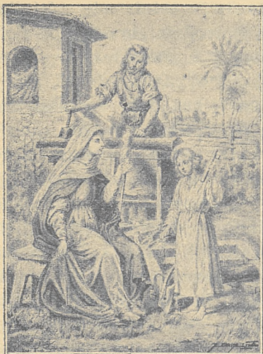
Św. Rodzina z Nazaretu.