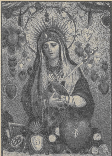
Bolesna Matka Boža Jerozolimimska