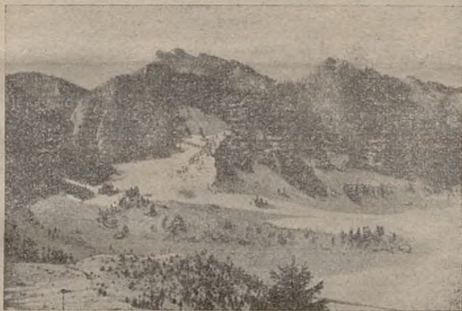
Podhalański, przepiękny pejsaż zimowy.

gandy i jej umiejętne prowadzenie zależy oczywiście w pierwszej linii od nas samych. z drugiej strony jednak istnieją również inne, obce czynniki, których działalność i troskliwe do nas ustosunkowanie mogłyby poważnie przyczynić się do wzmocnienia ruchu letniskowego i turystycznego. Tymi czynnikami są liczne stowarzyszenia sportowo-turystyczne, Liga Popierania Turystyki, stowarzyszenia, mające na celu urządzenie wycieczek, jak np. Orbis i td. i td.