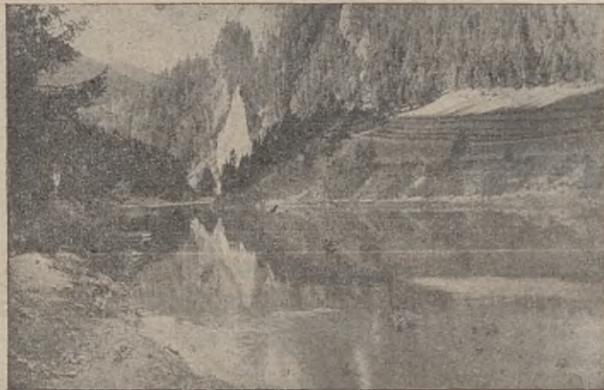
Widok na Pieniny i Dunajec