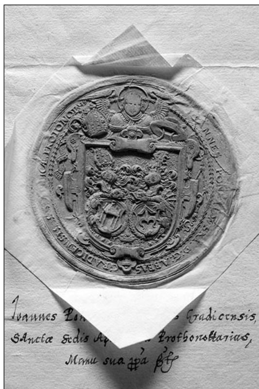
2. Pieczęć Jana Ponętowskiego