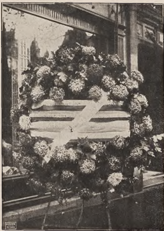
Wieniec złożony przez Sokolstwo Siowiańskie u mogiły Niezanego Żołnierza w Paryżu dnia 11 listopada 1928 r.

Przebieg uroczystości tej, choć skromnej lecz podniosłej, wywołał ogólny nastrój nadzwyczaj serdeczny i niewątpliwie przyczynił się do dalszego pięknego rozwoju Gniazda śródeckiego, które tak dzielnie pracuje w należytem zrozumieniu szczytnego hasła sokolego: zdrowy duch w zdrowym ciele!