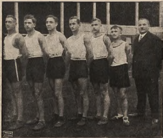
Sztafeta Okręgu Poznańskiego

Zgłoszenia z podaniem dokładnego adresu, zawodu i wieku przy równoczesnej wpłacie 5 zł, przyjmuje najpóźniej do dnia 15 grudnia r. b. tylko Klub Narciarzy w Rybniku, skrzynka pocztowa nr. 7. Wpłaty listowne, albo na P. K. O. 301.153. Liczba uczestników, ze względu na dobre umieszczenie, jak i wyszkolenie ograniczona na osobę 30.