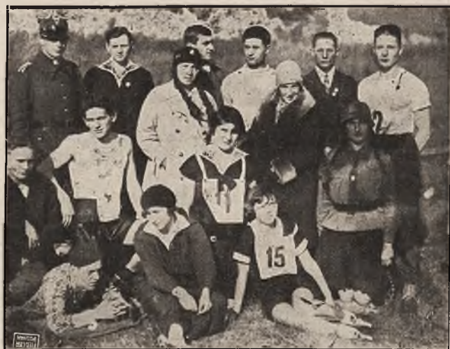
Grupa zawodników grudziądzkich na zawodach P. W. D. O. K. VIII. w Toruniu dnia 7. X. 28.

Na pierwszy plan wysuwa się Czechosłowacja, która przyśle około 20 doborowych zawodników. Zjadą oni już wcześniej, w początkach stycznia do Zakopanego, by opanować dokładnie tamtejsze