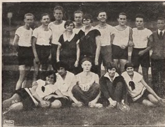
Grupa zawodników i zawodniczek na zawodach P. W. w Grudziądzu dnia 16. X. 28

dh. Grubińskim na czele, który uprzyjemnił pobyt wszystkim obecnym na zebraniu.