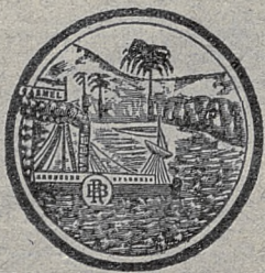
Марка утв. правительствомъ.

אלע וויינען און קאניאקען פון „כרמל“ (אויסער ווערמוטה) זענען כשר אויך פסח און עס איז אָבנעשיידט פון זיי חרומות און מעשרות כדון וכדת.