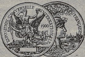
Золот. медаль Парижъ 1900.

כדי צו בעוואַרענען כרמל-וויין און קאניאקען פון נאכגעפֿעלטע פֿערקויפֿען מיר אונזערע וויינען אין קאניאקען נור אין פֿלעשער פֿערזיגעלט מיט אונזערע סטעמפעל און פֿערקניפט מיט דעם פֿלאַמבע פֿון „כרמל“.