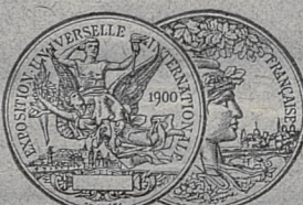
Золот. медаль Парижъ 1900.

ברו צו בעוואַרענען ברמל-וויין און קאניאקען פון נאכגעזעלשטע, פערקויפֿען מיר אונזערע וויינען און קאניאקען נור אין פלעשער פֿערוועלט מיט אונזערע סטעמפעל און פֿערקויפֿט מיט דעם פֿלאַזשע פֿון "ברמל".