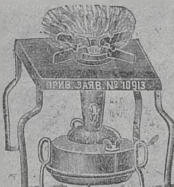
פּרֿוֿוילעגיע געמאַרדען נומר 10913

ביי דעם ערפינדער אליין, די לעצטע ניי-ערפֿונד-דענע מאַסיווע נאַפֿט-גאַזווע קיך און אַ קוויט "עקאָנאָמיש" מיט אַ פֿלוט, בעקוועמליכקייט, ברענט מיט אַ טרוקענעם גאַז, קאָכט געשווינד, גוט נישט אַרויס קיין שום געריך און רויך, און פֿערנוצט אין איין שטונדע פֿאַר 1/2 קאָפֿ נאַפֿט. מען קען אויך רעגולירען דאַס ווערען ווי מען וויל, אויך שיק אַרויס ער נאכאַהמע. דער פּרֿוֿיע מיט אלע צוואַטען מיט פּאַרטאַ: 1 שטיק—8,10 ר׳, 2 שטיק נור 5,60 ר׳; מיט 2 רעזערוואַרען אויף וועלכֿען מען קען מאַכען גלייכצייטיג 2 כלים—1 שטיק—5,25 ר׳, אין די ווייטע ערשער ווערט צוגעלייגט פּאַרטאַ פֿאַר׳ן געוויכט.