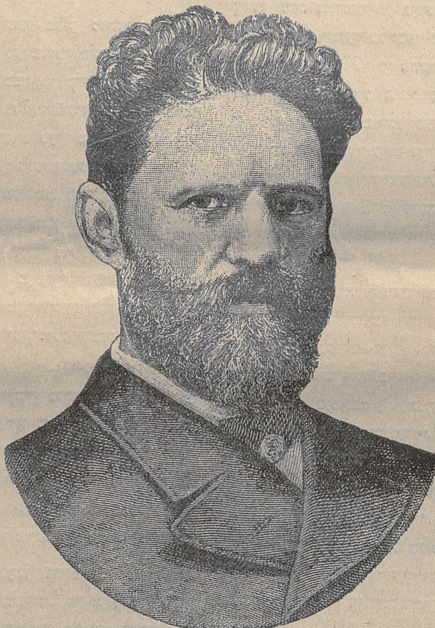
מרדכי בן מתתיהו אַנטאַקאַלסקי.

דער גרויסער רוסישער קינסטלער מרדכי בן מתתיהו אַנטאַקאַלסקי איז געשטאַרבען, זיין נאָמען האָט געקלונגען אין דער גאַנצער וועלט, און דורות וועלען נאָך פֿערגעהען איהרער זיין נאָמען וועט פֿער- געסען ווערען, דען ער האָט אונז איבערגעלאָזען זיינע ווערק. זיינע געשמאַלטען אין מאַרמאַר און אין בראַנזע, וואָס רעדען מיט אונז אַ שפּראַכע פֿון מענ- שען, וועלכע האָבען פֿיעל געקלערט און געליטען. זיין מול איז געווען אזוי גרויס, דאָס אויך ביי אונז אין דעם קליינעם יודישען וועלטלעך האָט מען פֿון אַנ- טאַקאַלסקי געהערט און גע- וואוסט. אַוועגס ביי אַוועק אין בתי מדרשים פֿלענט מען דערצעהלען וואונדער- ליכע היסטאָריעס פֿון אַ וויל- נער יודישען קינד, וואָס איז פֿריהער געווען אַ אַרימער יודישער שניצער און מיט דחקות און פיין פֿערדיענט דאָס שטיקיל ברויט. קיינער האָט נישט פֿערשטאַנען, וואָס פֿאַר אַ קונציגער שניצער דאָס איז, וואָס פֿאַר אַ גרויס טאַ- לענט עס ליגט בעהאַלטען אין דעם דאָזיגען 20 יאהר- נען בחור, וואָס פֿלעגט אָפֿט- מאַלס שמעהען מיט זיין אַרבייט ביי ווילנער שויל- הויף, ביז עס איז געקומען