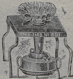
פֿריוילעגירט געמאלדען נומער 10918

ביי דעם ערפֿינדער אליין, די לעצטע ניי ערפֿונ- דענע מאסיווע נאָט-גאָזאָוע קיך אָהן א קנייט „עקאָנאָמיע“ מיט א פליטע „בעקוועמליכקייט“, ברענט מיט א טרוקענעם גאז, קאכט געשווינד, גייט נישט אַרויס קיין שום גערוך און ריך, אין פֿערניצט אין איין שטונדע פֿאַר 1/2 קאָפֿ נאָפֿט. מען קען אויך רעגולירען דאָס וועדען ווי מען וויל. איך שיק אַרויס פֿער נאכנאָמע. דער פֿרייז מיט אלע צודאַטען מיט פֿאַרמאָ: 1 שטיק 3,10 ר״, 2 שטיק 5,60 ר״; מיט 2 רעזערוואַרען אויף וועלכען מען קען מאַכען גלייכצייטיג 2 כלים — 1 שטיק 5,25 ר״, אין די ווייטע ערטער ווערט צוגעלייגט פֿאַרמאָ פֿאַרן געוויכט.