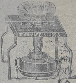
פּאַרטיקולערע געמאלדען נומבר 16918

ביי דעם ערפינדער אליין, די לעצטע ניי-ערפונ-דענע מאסיווע נאפּט-גאזאווע קיך אהן א קניש "עקאנאמיע" מיט א פלימע, בעקוועמליכקייט, ברענט מיט א טרוקענעם גאַז, קאכט געשווינד, גיט נישט ארויס קיין שום גערוך און רויך, און פערנוצט אין איין שטונדע פאַר 1/2 קאָפּ נאַפּט. מען קען אויך רעגולירען דאַס וועדען ווי מען וויל. איך שיק אַרויס פער נאכנאכהט. דער פרייז מיט אַלע צודאַטען מיט פאָרטא: 1 שטיק—10, 3 ר' / 2 שטיק גור 5,60 ר' / מיט 2 רעזערוואווארען אויף וועלכען מען קען מאַכען גלייכצייטיג 2 כלים—1 שטיק—5,25 ר', אין די ווייטע ערטער ווערט צוגעלייגט פאָרטא פאַר'ן געוויכט.