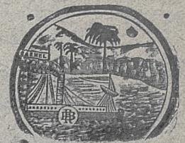
די מארקע איז בעשטעמט פון דער רומישער רעגירונג.