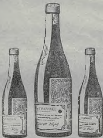
דער בעסטער מאגענפריינד.

פון אלע בעריהמטע וויינען קראַפטיגסט אים בעסטען דער וויין סט. רפאל. ער האט אין זיך פיעל טאנין און פרישט אויף, ער איז אויסגעצויכענט אין טעם. לויט דעם געוויסען פאָסטערס מיטטעל האלט ער זיך לאנג און ווערט נישט פֿערדארבען, צו יעדען פלאַשעל ווערד צו געגעבען א ביכעל פֿונ'ם דיר דע-באָרע: "איבער דעם וויין סט. רפאל ווי א הייל-מיטעל וואס זאָטיגט און קראַפטיגט"; פֿערקויפט זיך אין די בעסטע וויינגעשעפטען אויך אין אלע אפטייק-מאגאזינען און אפטיקען.