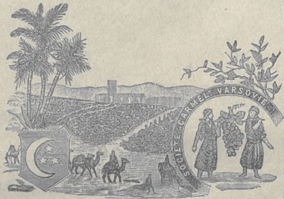
דער עטיקעט איז בעשטעטיגט פון דער רוסישער רעגירונג

אויסשליסליכער פערקויף פיר גאנץ רוסלאנד פון נאטירליכען ווייז און האניאק