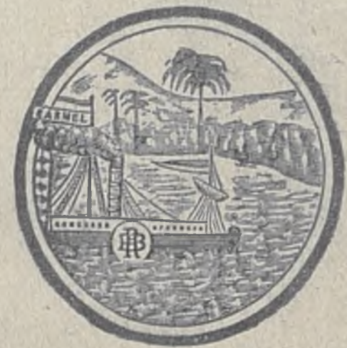
די מארקע איז בעשטעטיגט פון דער רוסישער רעגירונג.

הויפט-קאנטאר אין ווארשא, נאלעווי נוי 21, טעלעפאן נוי 1433.