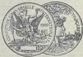
נאָלד-מעדאַל פאַר י 1900