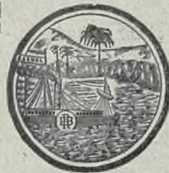
די מארקע איז בעשטעטיגט פון דער רוסישער רעגירונג.

וועלכע ווערען אויסגעארבעט אין באראן ראטהשילד'ס ווינקעלערען אין די ווידישע קאראניעס אין ארץ ישראל.