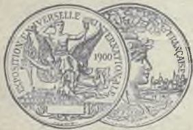
גאָלד-מעדאַל פאַרזײ 1900

וועלכע ווערען אויסגעארבעט אין באראן ראטהשילד'ס ווינקלערען אין די יודישע קאראניעס אין ארץ ישראל.