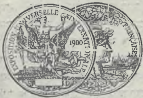
גאלד-מעדאל פארן 1900

די מארקע איז בעשטעטיגט פון דער רוסישער רעגירונג.