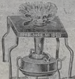
פרייוילעניע ג: מאדערן Nr. 10913

ביי דעם ערפינדער אליין, די לעצטע ניי-ערפונ-דענע מאסיווע נאש-גאוואוע קיך און א קנויט „עקאנאמיא“ מיט א פלימע „בעקוועמליכקייט“, ברענט מיט א טרוקענעם גאז. קאכט געשווינד, גיט נישט ארויס קיין שום גערוך און רויך, און פערניצט אין איין שטונדע פאר 1/2 קי נאשט. מען קען אויך רעגולירען דאס ווערען ווי מען וויל. איך שיק ארויס פער נאכנאמען. דער פרייו מיט אלע געשיר מיט פארטא: 1 שטיק—3,10 ר', 2 שטיק נור 5,60 ר'; מיט 2 רעזערוואווארען און אויף וועלכען מען קען מאכען גלייכצייטיג 2 כלים—1 שטיק—5,25 ר', אין די ווייטע ערטער ווערט צוגעלייגט פארטא פאר'ן געוויכט.