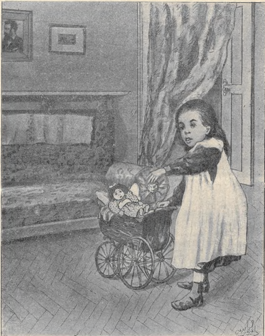
ה. משורני: ה'אם ה'קטנה.