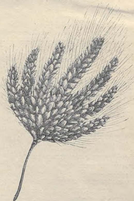
שְׁבָע שְׂפִלִים עוֹלֹת בְּקִנְיָה אַחֶר.