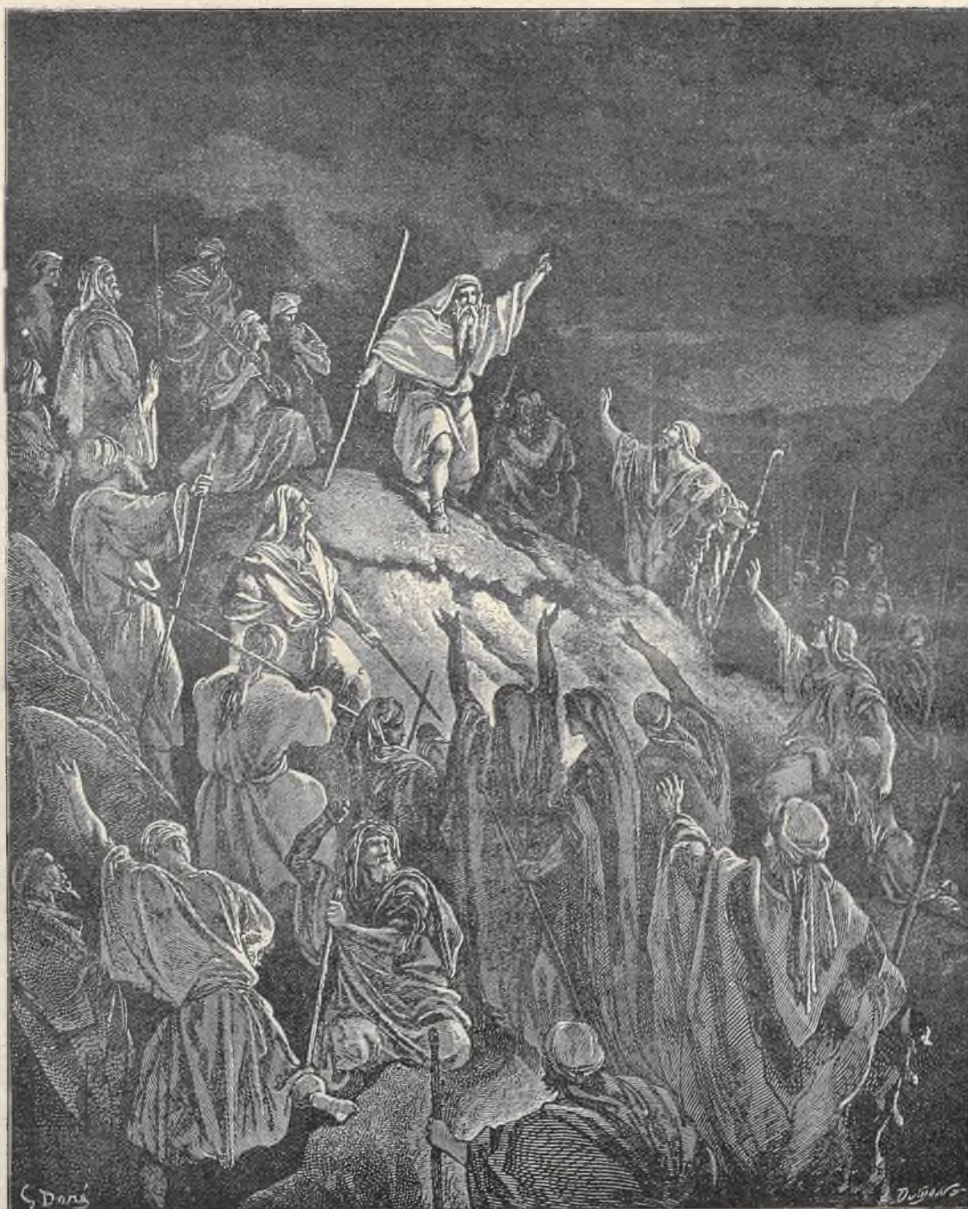
ג. דורה: מתתיהו קורא לעם לצאת נגד האויב.