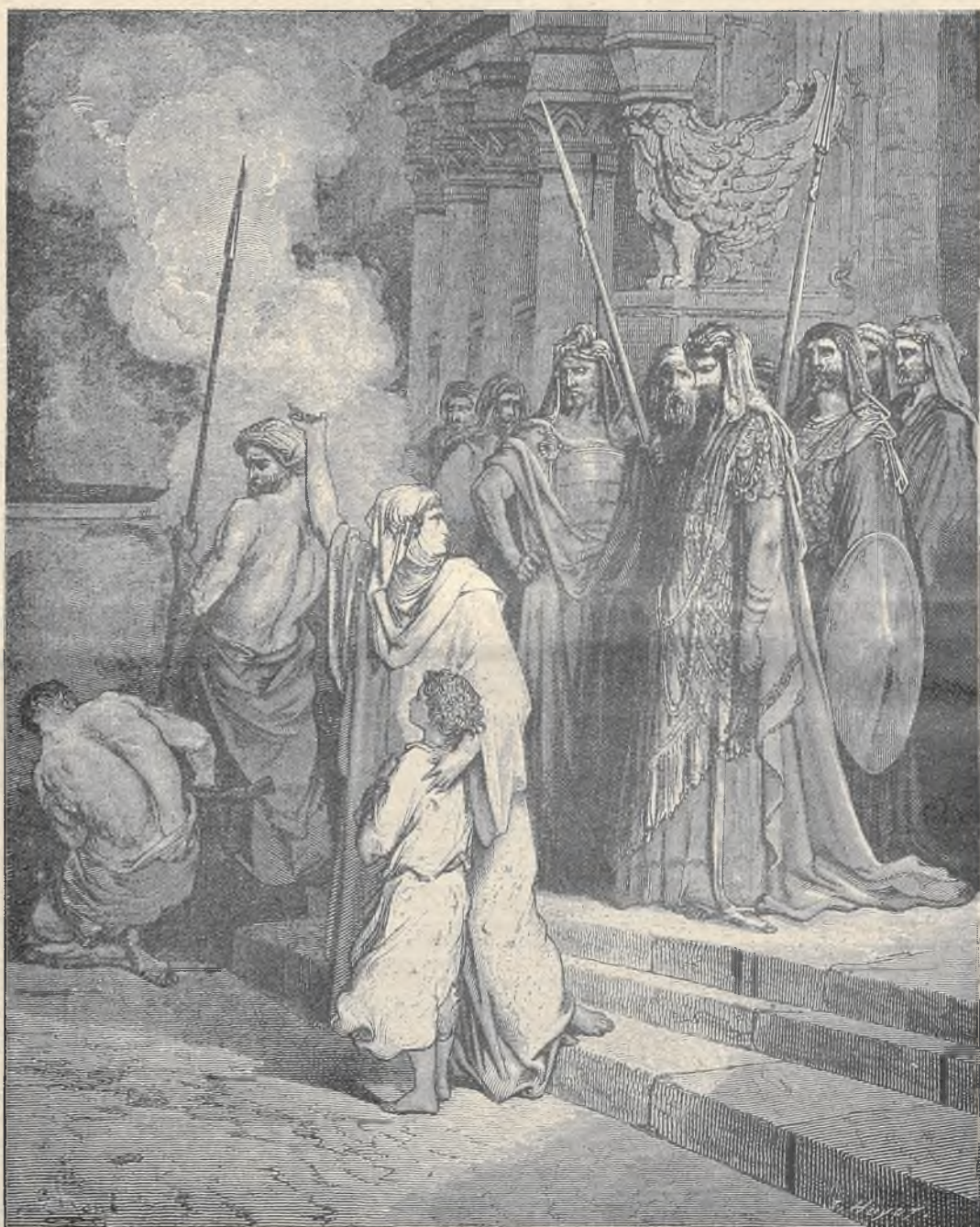
ג. דורה: חנה ושבעת בניה.