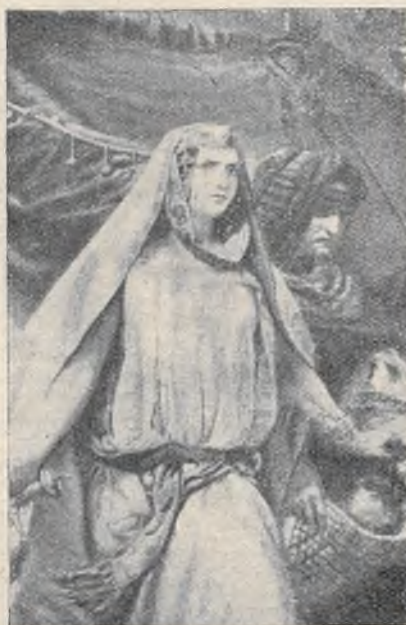
ה. וִירְנָה: יְהוּדִית

לְעֵינֵיהֶם מִבֵּין הַהָרִים; וַיִּבְאוּ שְׂמֵחַ וַיִּפְּצְחוּ עַל צָבָא הַגִּבּוֹרִים