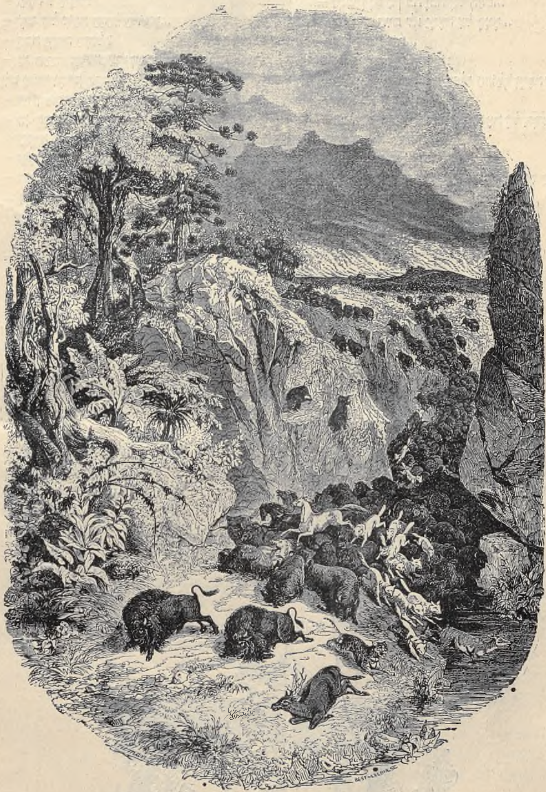
בַּעֲרַת יַעַר בְּאַמְרִיקָה הַדְּרוֹמִית.