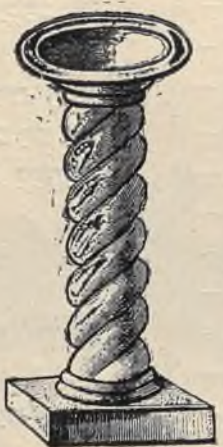
ה ב י ו ר