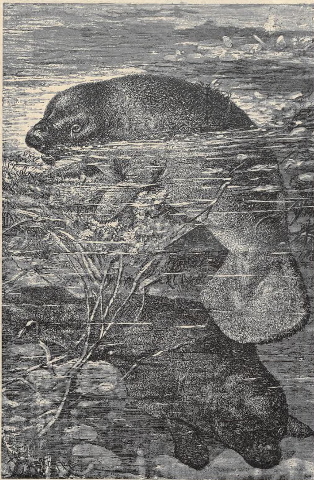
שפיקט: פֶּרֶת הַיָּם.