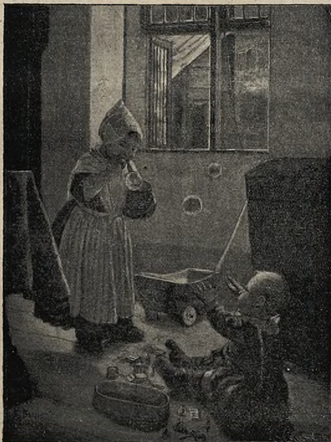
אכעבועות של פריית.