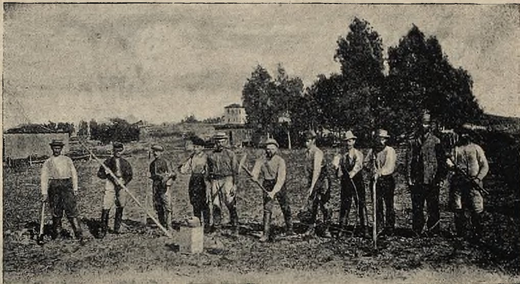
רחובות (על פי כרטיס של הוצאת לבנון).