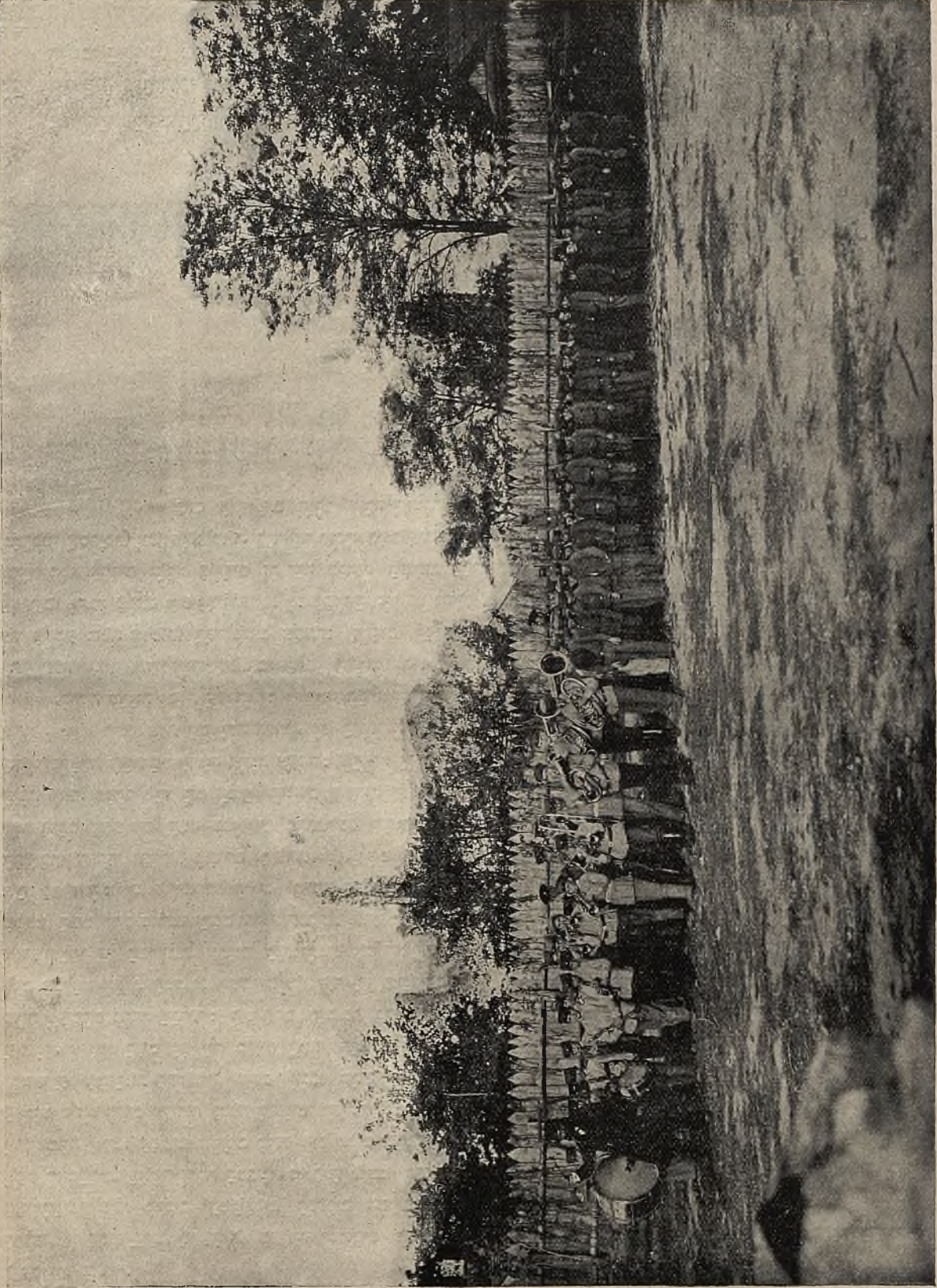
המסע (1918) ברחבי הארץ