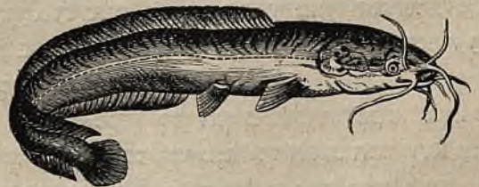
דגני ים כנרת.