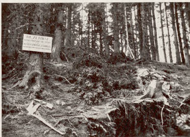
«Rezerwat» w pojęciu kierownictwa budowy kolejki; napis ten umieszczono w zniszczonym lesie. The inscription «Reserve» on a board installed as if by irony by the direction of the rope-railway works who destroyed the forest.