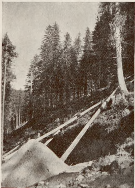
Bezplanowe kopanie dołów dla wydoby- cia piasku i niszczenie przytem lasu.

VIII. 6 kwietnia 1934 delegacja Wydziału Państwowej Rady Ochrony Przyrody przedkłada na audjencji Panu Ministrowi Wyznań Religijnych i Oświecenia Publicznego memoriał, w którym uzasadnia swe stanowisko.