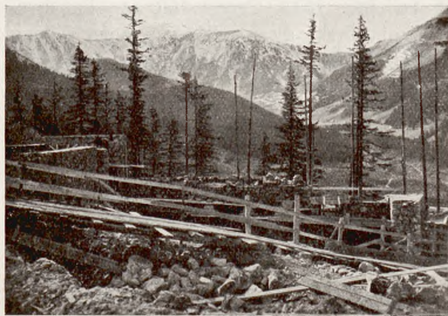
Fragment budowy wielkiej stacji na szczycie Myślenickich Turni.