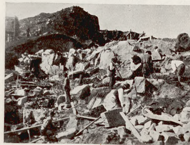
Praca w kamieniołomie pod szczytem Kasprowego Wierchu. Works in the stone-pit at the foot of mount Kasprowy.

W szczególności uważają eksperci, że: «wysoce szkodliwe, a pod względem gospodarczym nierealne i niedopuszczalne są jakiekolwiek kolejki szczytowe we właściwych Tatrach. W razie istotnej potrzeby budowa takich kolejek możliwą jest tylko u podnóża Tatr».