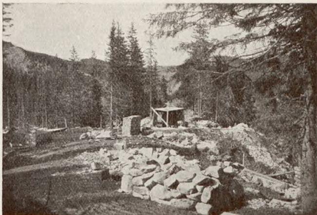
Obraz zniszczenia przyrody na szczycie Myślenickich Turni.

«Myśl przekształcenia Tatr na jeden wielki, największy w Europie, liczący 50 tysięcy hektarów rezerwat, jest tem piękniejsza, że do jej realizacji podały sobie ręce Polska i Czechosłowacja... Nadzór nad lasami tatrzańskimi obejmie Komisja Parku Tatrzańskiego, analogicznie do Komisji istniejącej dla Parku Narodowego w Pieninach».