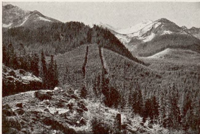
Dwie szerokie linie, wycięte w lesie na Myślenickich Turniach, szpecące krajobraz. Two large lines cut out in the forest on Myślenickie Turnie.

XIII. W czasie od 19 stycznia 1934 do końca września 1935 ukazało się w prasie 390 artykułów i notatek przeciw kolejce, zamieszczonych w 91 pismach. W tym okresie za budową było w prasie 67 artykułów (w tem w Ilustrowanym Kurjerze Codziennym i Światowidzie 49).