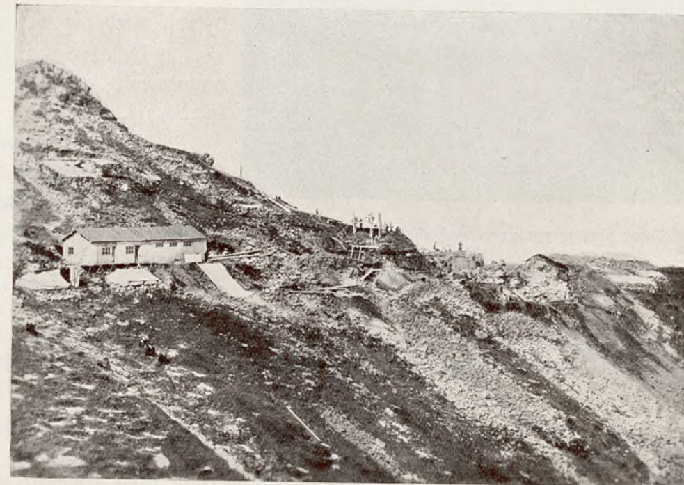
Zniszczenie przyrody pod szczytem Kasprowego Wierchu w związku z rozpoczęciem budowy kolei linowej w Parku Narodowym w Tatrach.

Nature destruction at the foot of mount Kasprowy in relation to the construction of the rope-railway in the National Park in the Tatras.