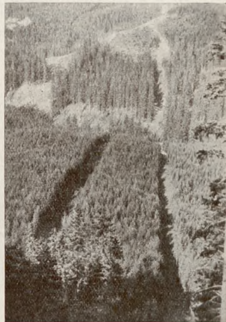
Widok z Myślenickich Turni na las zniszczony liniami leśnymi i siecią dróg. View from Myślenickie Turnie on the primeval forest destroyed by rope-railway lines and ways.

«Fundacja «Zakłady Kórnickie» sprzedaje Skarbowi Państwa na cele Parku Narodowego, a Skarb Państwa kupuje dobra Bukowina, Brzegi, Kościelisko i Zakopane».