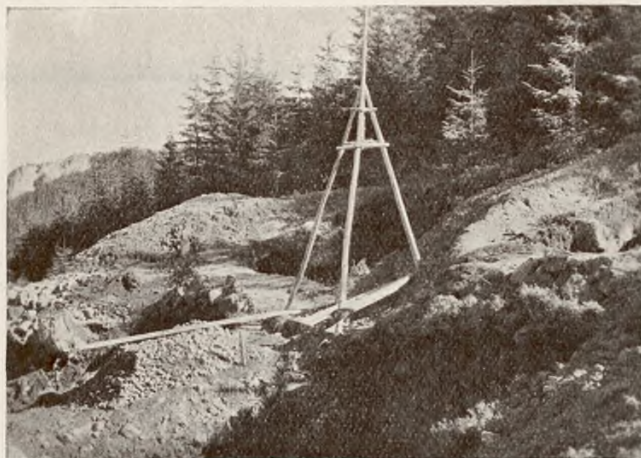
Teren prac przygotowawczych dla budowy jednego ze słupów.

Preliminary works for the construction of one of the pillars.