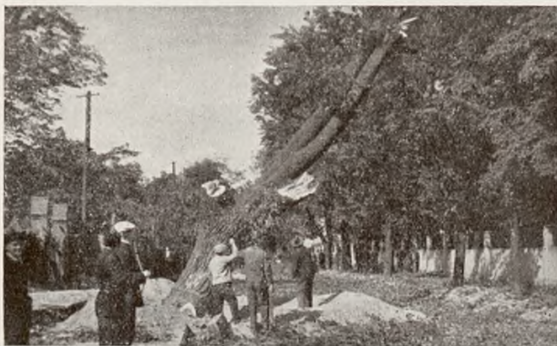
Ryc. 5. Pomnikowe drzewa przy ul. Bukowskiej w Poznaniu podczas wycinania.

W roku bieżącym spotkałem się, niestety, na Opolu z tego rodzaju kulturą sosny, założoną na przyleśnej halawie w Żołnówce k. Brzeżan. Halawę tę porasta w całości bujny zespół seslerii Heufflera ( Seslerietum Heufflerianae ), po raz pierwszy w tej