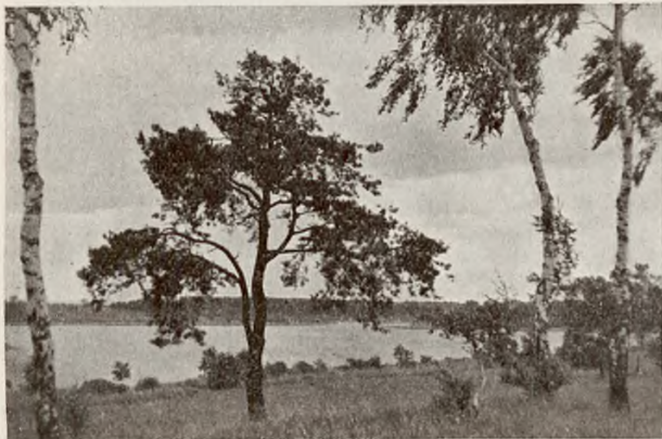
Ryc. 3. Jezioro Strzeszyńskie pod Poznaniem.