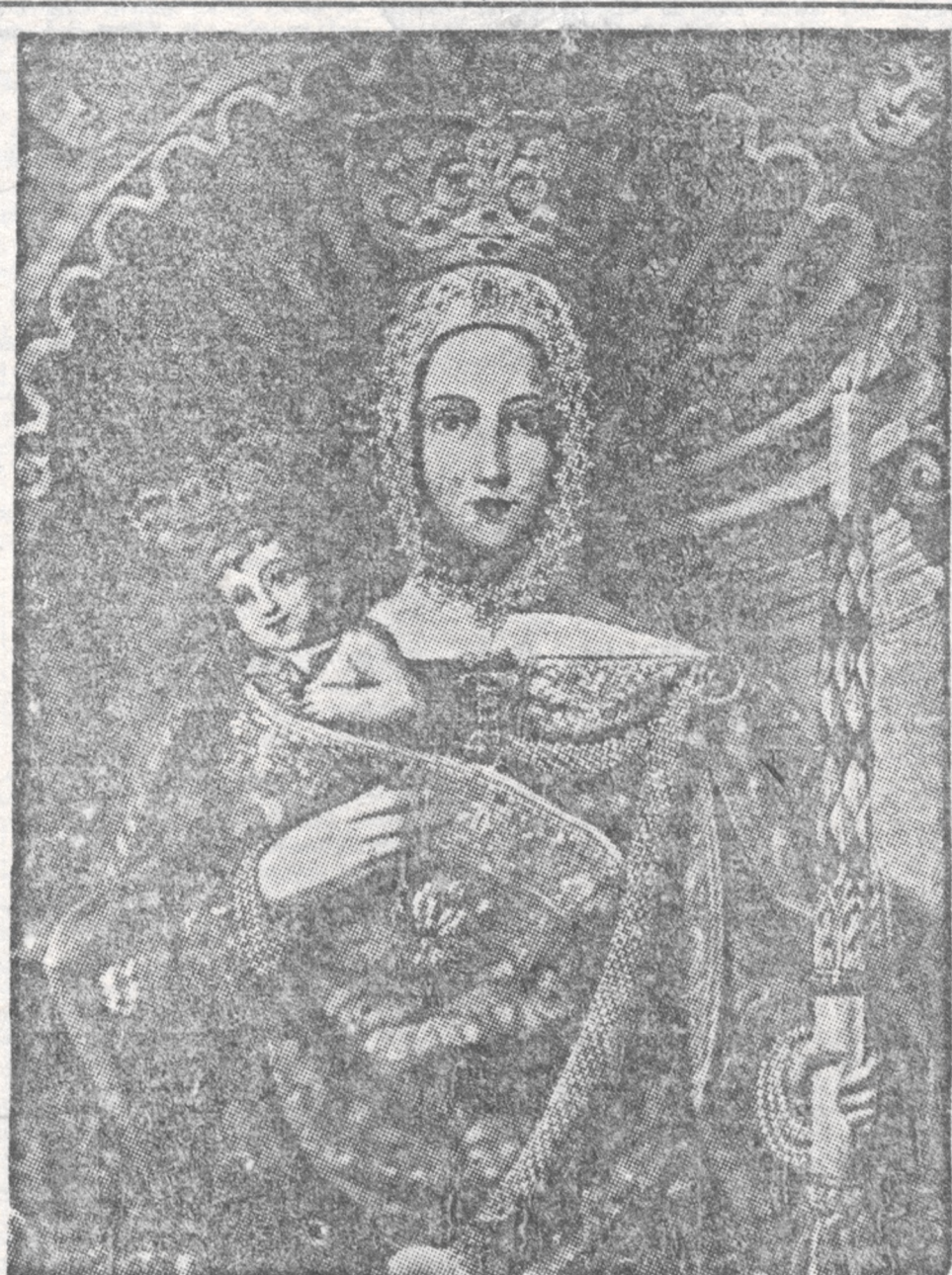
TEN PRZEPIĘKNY, NIEZNANY DOTYCHCZAS LWOWIANOM ZUPEŁNIE OBRAZ MATKI BOSKIEJ GROMNICZNEJ ZNAJDUJE SIĘ W ZAKRYSTII KLASZTORU DOMINIKANÓW WE LWOWIE. POCHODZI Z WIEKU XVII. JEST ZAPRAWNE DZIEŁEM LWOWSKIEJ SZKOŁY MALARSKIEJ. ODSZUKAŁ I OPISAŁ GO DR. TADEUSZ MANKOWSKI W PRACY: „LWOWSKI CYCH MALARZY W XVI I XVII WIEKU“. (LWÓW 1936).

Z wynurzeń samych Anglików wynika, że w roku 1918 stali już oni u kresu swych sił i u progu swego upadku, kiedy właśnie — na kwadrans przed dwunastą — udało się zrealizować upragnioną przez nich rewoltę w Niemczech. Po załamaniu się w listopadzie 1918 roku wystąpił Woodrow Wilson, który zapowiedział nową epo-