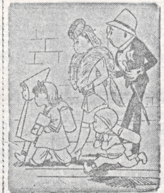
Urodziłam się w Berlinie, a do szkoły chodziłam w Hamburgu. Biedne dziecko, toś miała daleką drogę do szkoły.