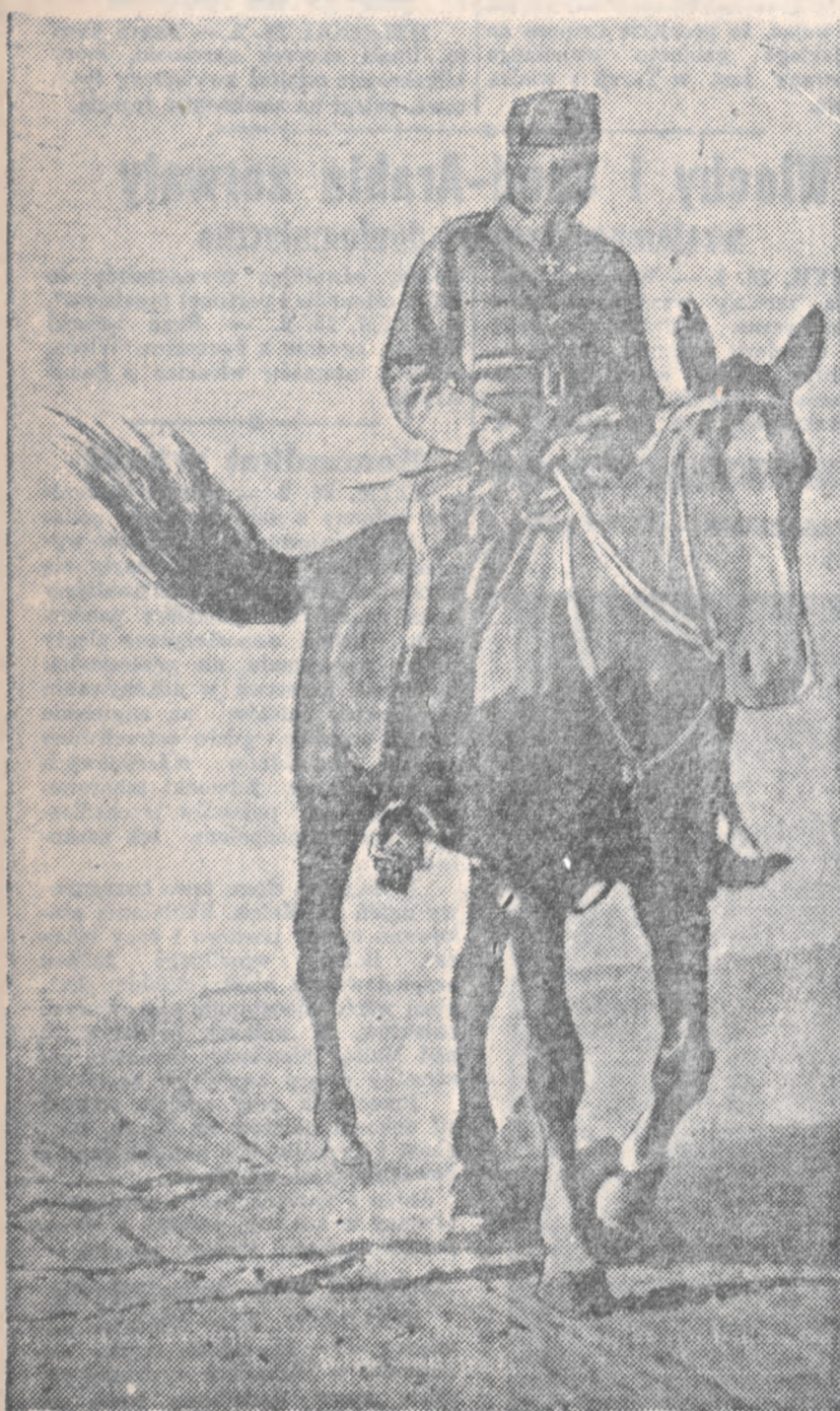
MARSZAŁEK FINÓW — MANNERHEIM NA SWOIM ULUBIONYM WIERZCHOWCU

Duszą fińskich walk wyzwolenczych jest marszałek Mannerheim. — Z twarzy 74-letniego marszałka przebija żołnierska prawość i niezłama wola. Przenrowski on swój naród przez niejedną Scyllę i Charybdę trafnością swojej decyzji. Toteż Finowie z całym zaufaniem oddali w ręce uwielbianego wodza losy swego „Suomi“ i z całą ufnością wyczekują, co im przyniesie przyszłość.