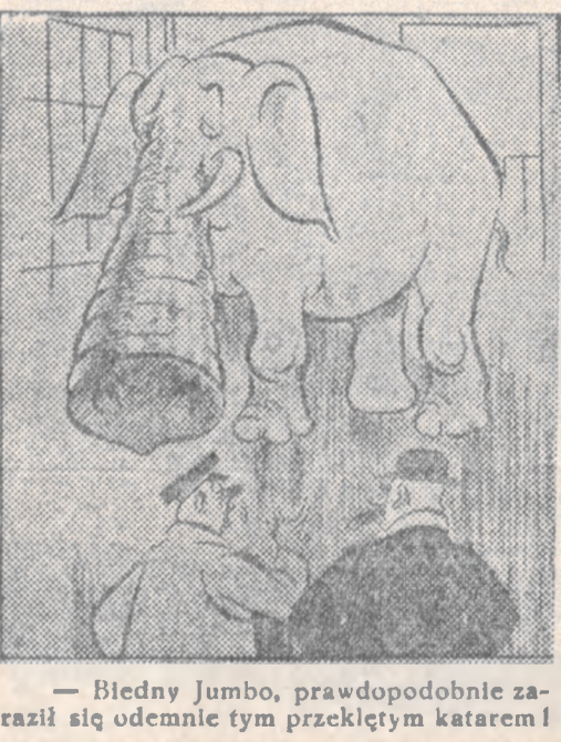
— Biedny Jumbo, prawdopodobnie zaraził się odemnie tym przekłętym katarem!

SPRZEDAŻ kilim 2 1/2-2; 3 dozorcy, Lwów — św. Anny sześć, — od 10-15. 10176