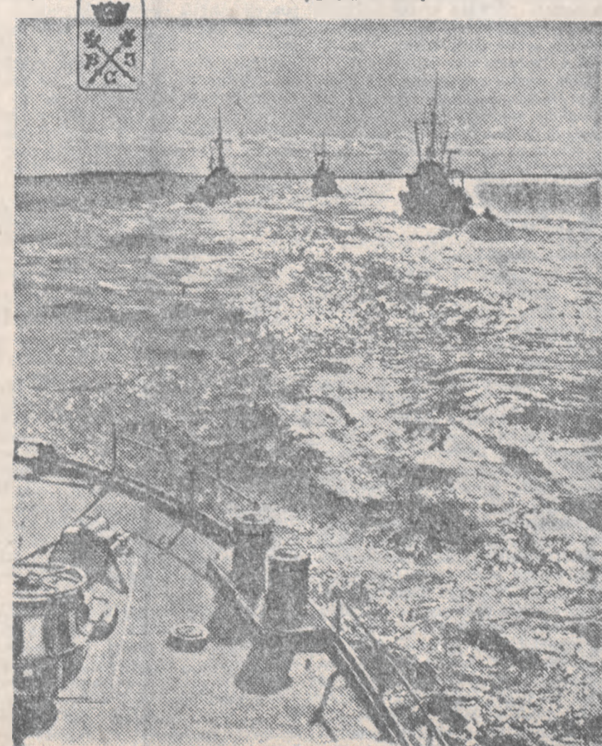
FLOTYLA POLAWIACZY MIN W CZASIE AKCJI NA BAŁTYKU

Ambasador Franciszek Papan, liczący lat 63, był w czasie pierwszej wojny światowej attaché wojskowym w Waszyngtonie i w Meksyku. Przez czas pewien służył jako oficer sztabowy na froncie zachodnim. W roku 1932 został Kanclerzem Rzeszy. Współpracował nad rozwiązaniem sprawy Zagłębia Saary. Jako ambasador w Wiedniu rozwinął owocną działalność. Obecnie, jako wytrwały dyplomata, zajmuje stanowisko ambasadora w Turcji.