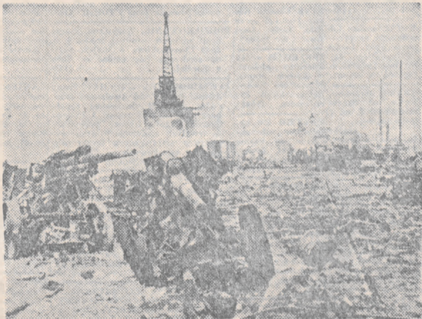
Tak wygląda dzielnica portowa Odessy po nalocie nurkowców niemieckich.

SZTOKHOLM, 8. 3. — Jak dono- szą z Teheranu, kryzys rządowy w Iranie nie znalazł jeszcze, jak dotąd, rozwiązania. Nastroje w Teheranie są niezwykle naprężone i skierowane są przede wszystkim przeciwko So- wietom, które robią wszystko w tym kierunku, aby doprowadzić do prze- silenia rządowego i obalić rząd.