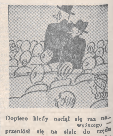
Dopiero kiedy naciął się raz na — wyższego — przeniósł się na stałe do rzędu pierwszego — (kat)