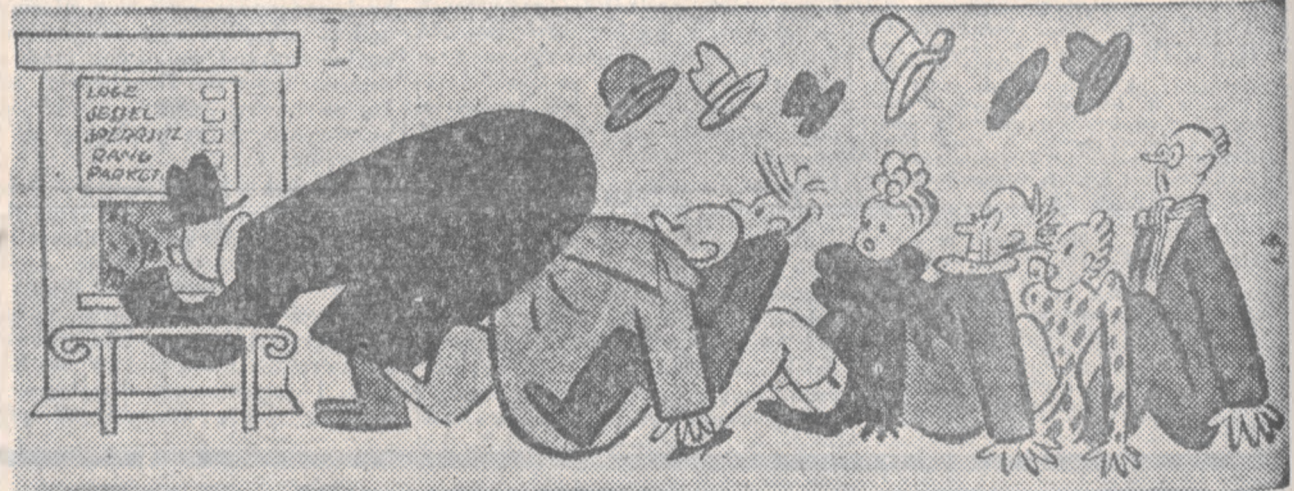
Prawdziwy dramat się zaczyna