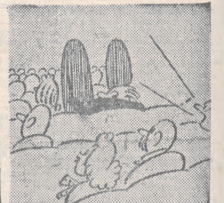
Choć w końcu postać jest schowana — to zasłaniają znów — kolana.