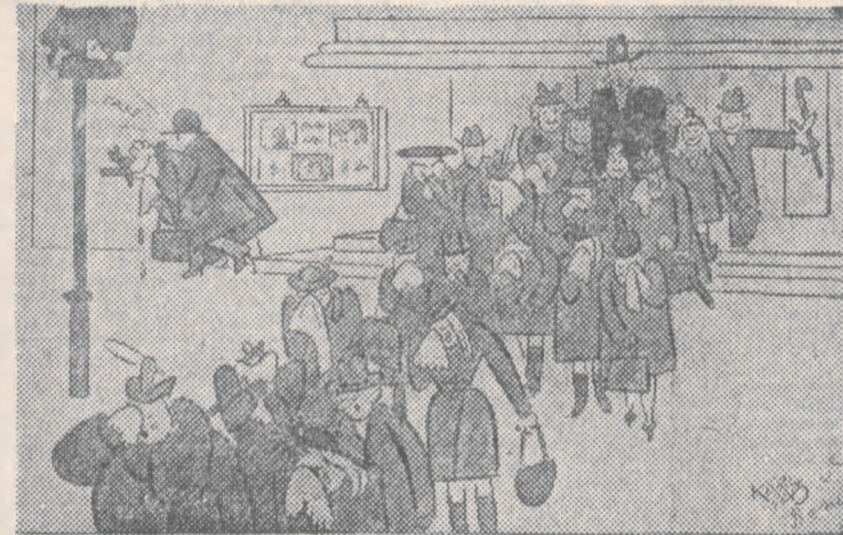
Szczęśliwi, co za nim siedzieli: smutnego filmu nie widzieli...