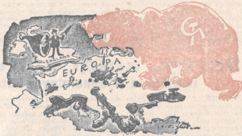
CRIPS: „BIERZ CAŁĄ EUROPE, ALE WARA CI OD MOJEJ SZYNKI!”