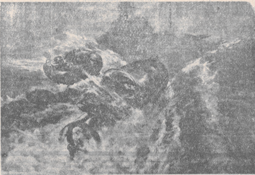
ŻYWA TORPEDA JAPONSKA TUŻ PRZED CELEM

Pierwsza istotnie wielka bitwa morska obecnej wojny pomiędzy flotą japońską i głównymi siłami alianckiej floty południowo-zachodniego Pacyfiku została zakończona, co było równoznaczne ze zwycięstwem morskich sił zbrojnych Japonii”.