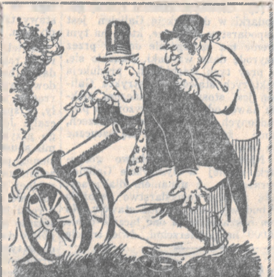
Spróbujmy, czy też wystrzeli...

KLEJ DO DETEK — „Lira” Lwów, Kopernika 10. 12968